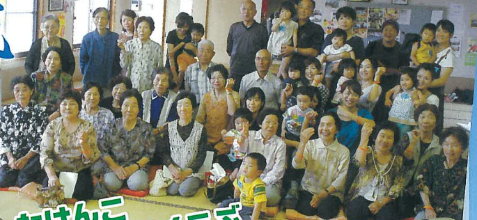
たけんこ あくりっこくらぶ 城山サロン