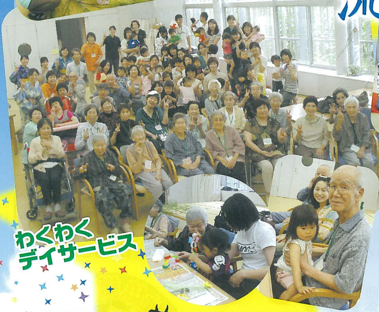
わくわく デイサービス