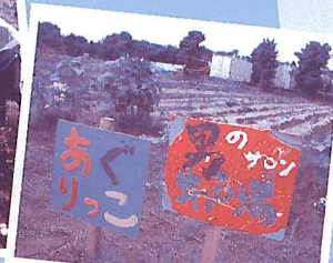
「あぐりっこくらぶ」 手作り看板です

ふれあい館の農園で旬の野菜の収穫が行われました。日頃より農園で野菜や花を育て、地域との交流に協力いただいているボランティアグループの「男の井戸端サロン」とこども支援センターに集う「あぐりっこくらぶ」の親子グループ、デイサービスを利用される高齢者の方々の参加でジャガイモの収穫がありました。