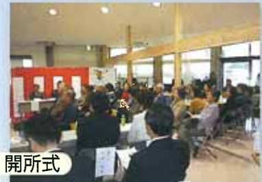
11/7 南ヶ丘福祉支援センター輝き館「ひかり」開所式