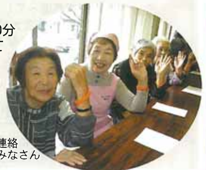
10/26 須屋コミュニティ 地域福祉連絡 協議会東須屋区の受講者のみなさん