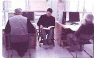
ワード・インターネット教室 テクニカル工房