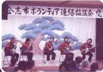
合志市ボランティア連絡協議会交

……以上のことを大きな目的として実施しました。当日は大盛況で、各団体も新旧入り混じり、互いの活動に敬意を払い、笑顔で交流することができたのではないのでしょうか？地域の福祉力の大きな担い手である皆様と一緒に今後も手を携えて、地域福祉活動に尽力してまいります。