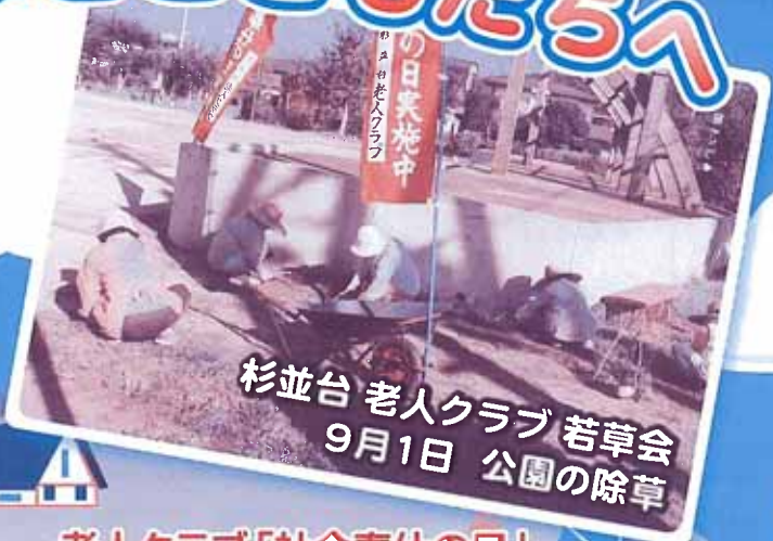
杉並台 老人クラブ若草会 9月1日 公園の除草