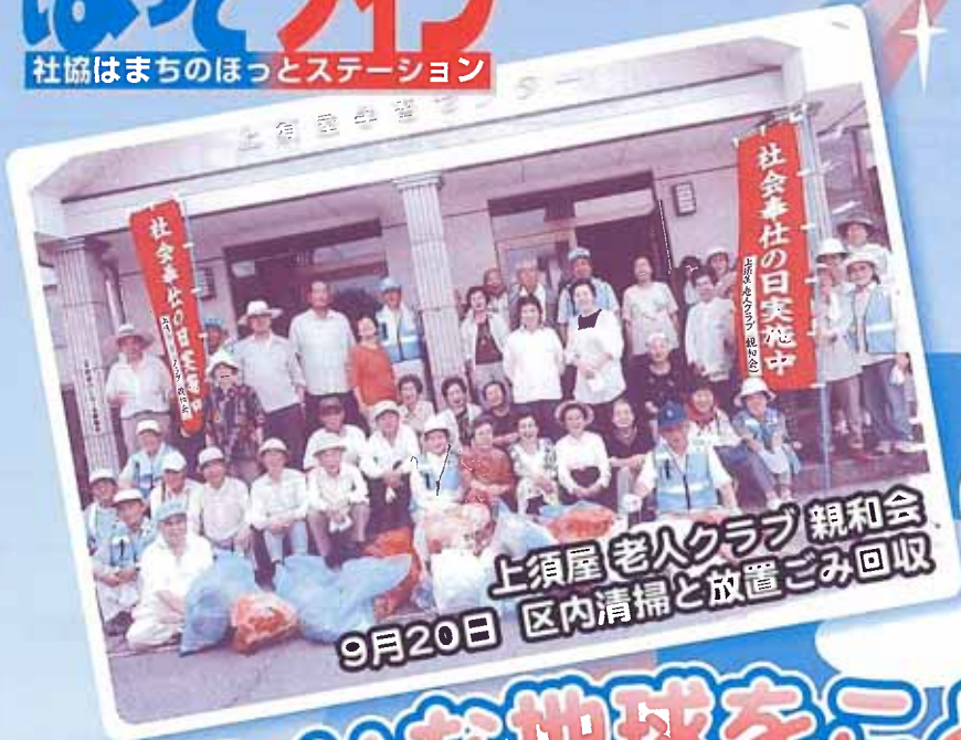
上須屋老人クラブ親和会 9月20日 区内清掃と放置ごみ回収