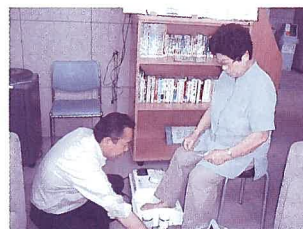
6/13栄泉会での教室の様子