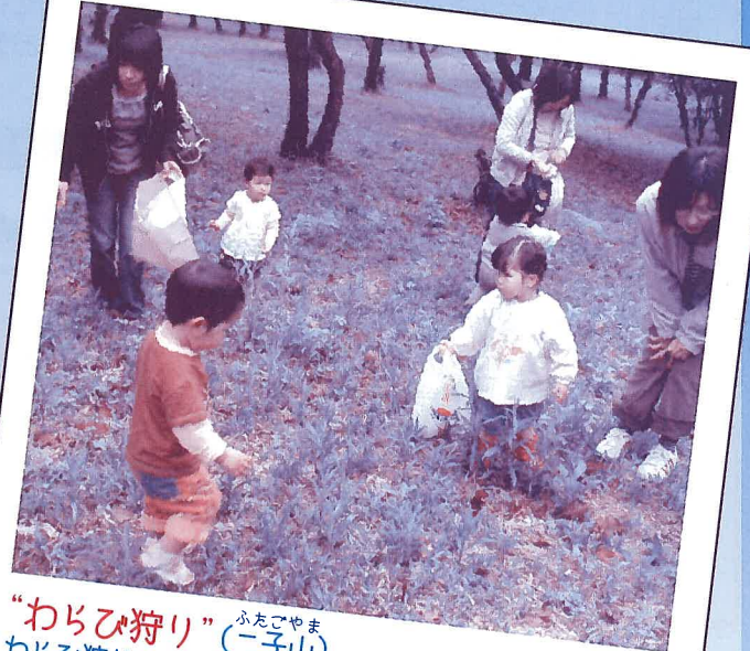
“わらび狩り” ふたごやま （二子山） わらび狩りが初めての小さい子どもさんも楽しめました。 二子山石器製作遺跡（野々島）もあり、秋は山栗もあるそうです。