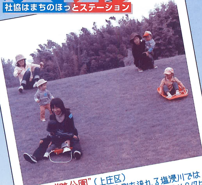
“竹迫城跡公園”（上庄区） 5月下旬ごろより、公園北側を流れる塩浸川では、 ホタルの乱舞もみられるそう、5/31から6/7は 「ほたるまつり」が開催されます。