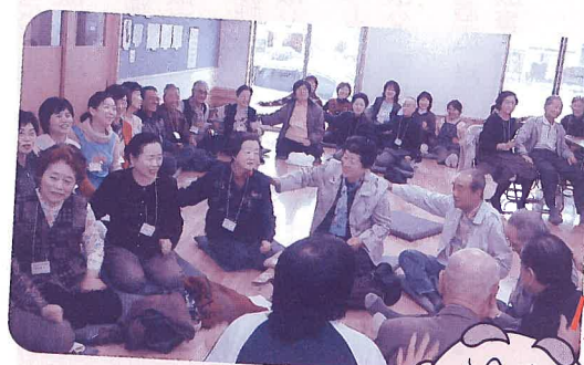
レクリエーション 「すりすりトントン」 手のひらから温かさが伝わります

総勢48名の参加があり、公民館は笑い声でいっぱい2時間でした。ご夫婦での参加も多くみられ、今後も参加者が楽しめる内容がたくさん計画されています。