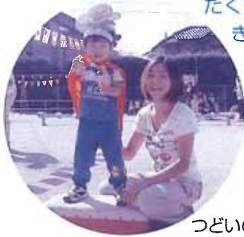
つどいの広場“わかば”運動場

たくさんの方に参加いただき、みんな元気いっぱい体を動かししました。お天気にも恵まれ、交流をしながら笑顔いっぱいの運動会でした♪