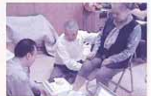
11/5(須屋区)骨密度測定