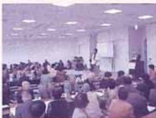
ユーパレス井天にて