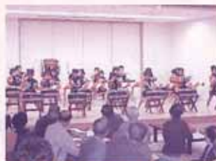
恒例の六華保育園との交流