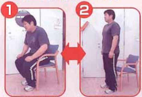
椅子からゆっくりと立ち上がる。 ゆっくりと腰かける。 これを繰り返す。