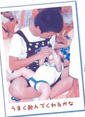
(小学生、デイサービスとの交流)