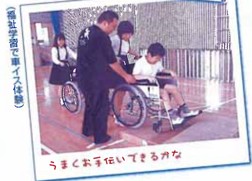
(福祉学習で車イス体験)