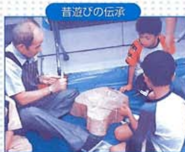
昔遊びを通して交流