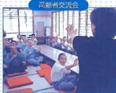
平成9年より高齢者の訪問活動からはじまり毎年行われています。