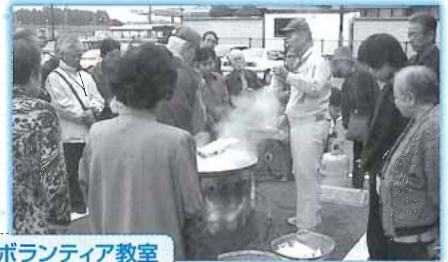
防災ボランティア教室