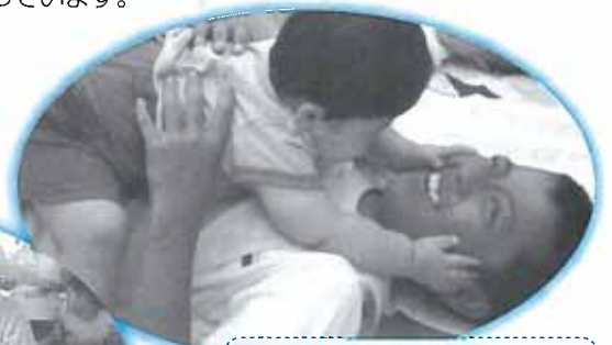
中学生 赤ちゃんふれあい体験