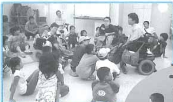
障害をもつ方との交流会

幼児期から積極的に地域住民とのふれあい活動や福祉体験を行う事で、共に生きる社会を学び、すべての人やふるさとを大切にする“こころ”を育てることを目的に行っています。