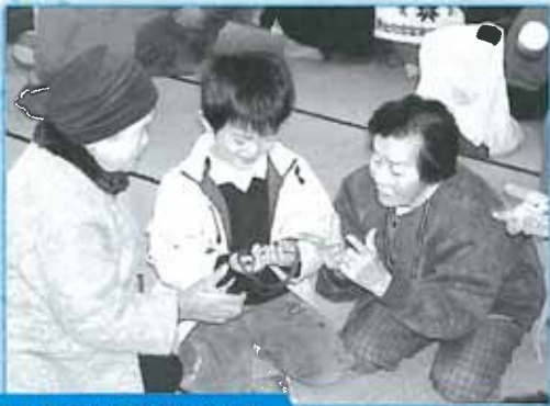
小地域福祉活動支援 (地域福祉連絡協議会)

高齢になっても障害をもっても住み慣れたところで、自分らしく暮らせるように各種団体と協働して取り組んでいます。