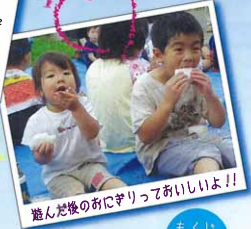
遊んだ後のおにぎりっておいしいよ!!