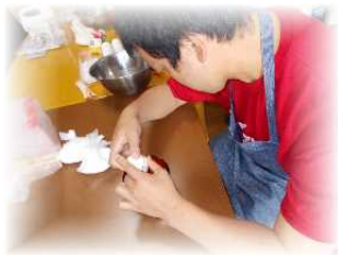
卵の分離はムズカシイ・・・

ご利用者の方から、何か作って食べながら楽しく過ごしたい・・・とのご要望もあり、れんがの家のキッチンで小麦粉とヨーグルトを使って「ふわふわパンケーキ」を作りました。小麦粉をふるったり生クリームを泡立てたり、卵白でメレンゲを作ったり、得意分野?の分業で緊張しながらも楽しく料理ができました。パンケーキと珈琲をいただきながら話もたくさんできました♪