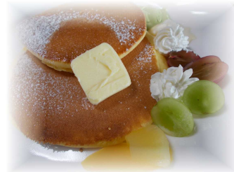
ふわっふわにできました♪