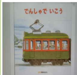
「でんしゃでいこう」 作：間瀬なおかた

ドテン…ドトン…と電車が山の村を通って行きます。穴あきページのトンネルを抜けると景色が一変。前から後ろからも読める、楽しい乗り物しかけ絵本です。