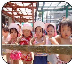
わーい! 何が流れてくるのかな?