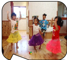
かわいい衣裳で、リズムに合わせて踊ってます