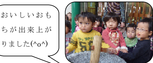
おいしいもちが出来上がりました(^o^)