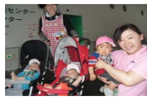
6月・梅雨の季節を楽しみながら、1日元気に過ごしました。