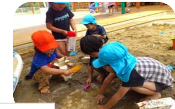
☆アンパンマン&バイキンマン